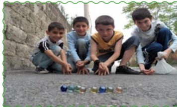
Misket ( Bilye )