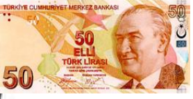
50 Türk Lirası 50 TL