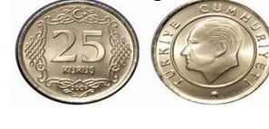
25 Kuruş 25 kr