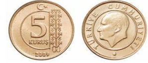
5 Kuruş 5 kr