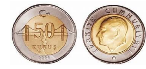
50 Kuruş 50 kr