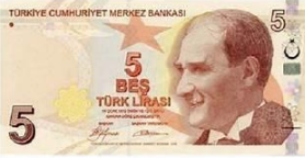
5 Türk Lirası 5 TL