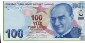
100 Türk Lirası 100 TL