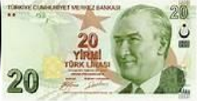
20 Türk Lirası 20 TL