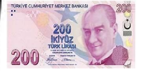
200 Türk Lirası 200 TL