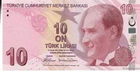
10 Türk Lirası 10 TL