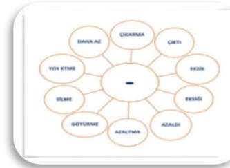
Çıkarma İşl. İfadeleri Deftere Yapıştırma