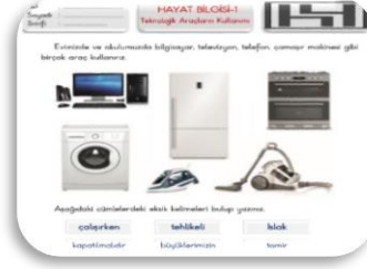
Teknolojik Araçların Kullanımı