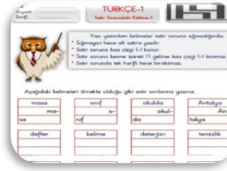
Satır Sonuna Sığmayan Kelimeler