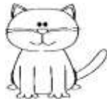
2. Cat : kedi