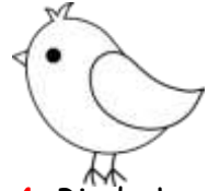
4. Bird : kuř