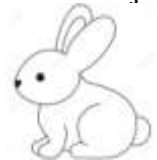
8. Rabbit : tavřan