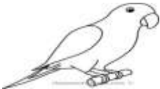
5. Parrot : papaęan