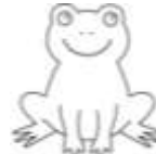
7. Frog : kurbaęa