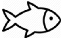
6. Fish : balık