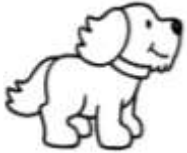
1. Dog : köpek