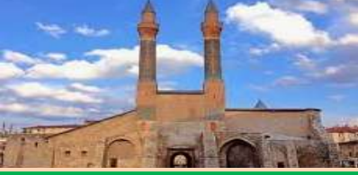
İshak Paşa Sarayı