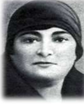
Ali Rıza Efendi