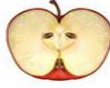
İki Yarım Elma