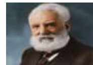
Alexander Graham Bell