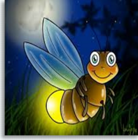
5- Ateş böceği