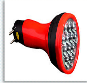
8 - El feneri