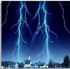
11 - Şimşek