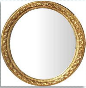
10 - Ayna