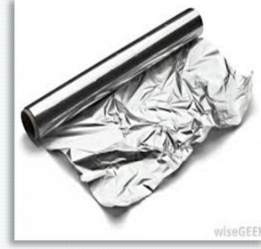
9- Alüminyum folyo