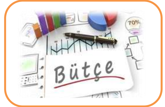
YILLIK BÜTÇE PLANI

Bütçe, gelirlere göre hazırlanır. Her ailenin gelirine göre hazırlayacağı bir bütçesi olmalıdır. Aile bütçemizi hazırlarken gelir ve giderlerin denk olmasına dikkat etmeliyiz. Sorumsuzca hareket edip gelirlerinden daha fazla harcama yapan ailelerin borçlanmak zorunda kalacaklarını unutmamalıyız. Bu nedenle bütçemizin giderler bölümünde ev kirası, yakıt, elektrik, su gibi temel ihtiyaçlarımıza öncelik vermeliyiz.